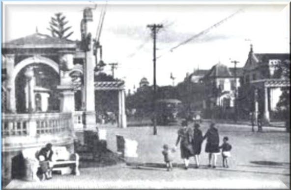
Avenida Paulista Início século XX