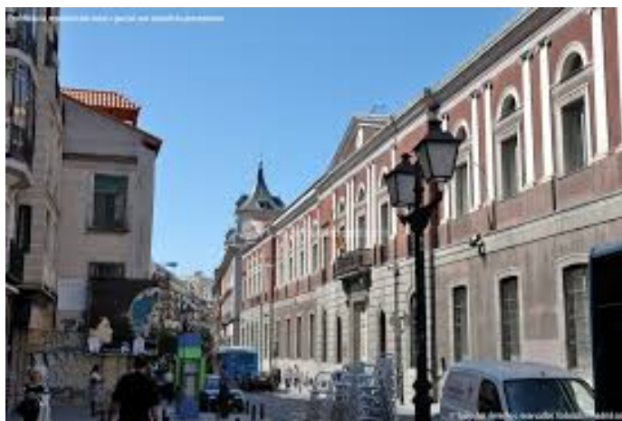
Universidade Central de Madrid