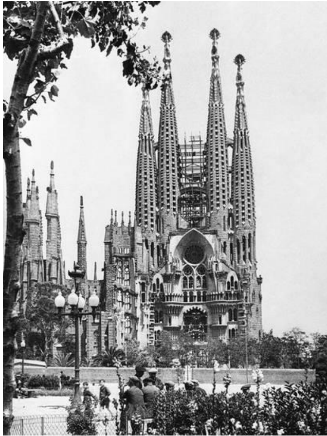
Catedral da Sagrada Família (obra do arquiteto Antoni Gaudí), ontem e hoje